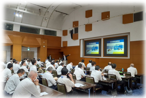
①乗務員全体研修（関東地区）