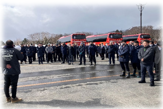
③雪上研修（群馬で実施）