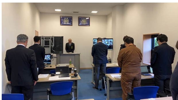
リモート開催での黙祷の様子(桜交通本社)

なお、新型コロナウイルス感染症以降、遠方の営業所についてはWebによるリモートでの参加となっております。