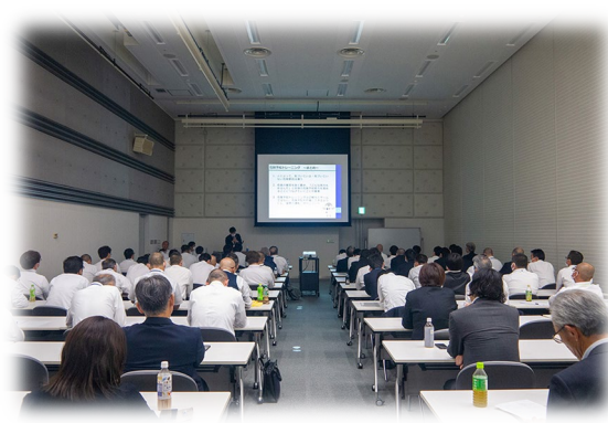
②乗務員全体研修（東北地区）