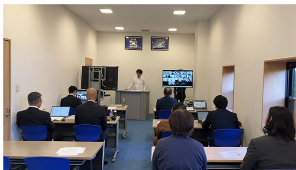
代表取締役による事故防止に関する決意表明