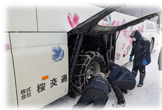
④雪上研修（福島で実施）